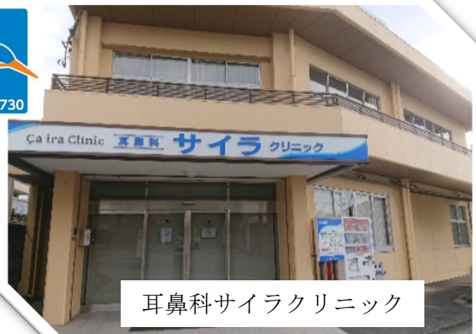
耳鼻科サイラクリニック