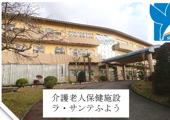
介護老人保健施設 ラ・サンテふよう

・睡眠時無呼吸症候群の検査を行っています。ご心配な方ご相談ください。 めまいの検査・聞こえの検査・甲状腺・頸部エコー検査・鼻のCT検査 等 行っています。自費にて血液検査も出来ます。