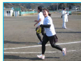
Bチーム第4走者 伊邑(薬局) スタート直後の洗刺とした表情！！