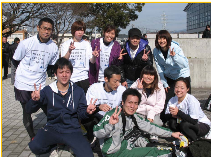
最後にA・Bチーム全走者で記念写真！！ 皆さん、お疲れさまでした